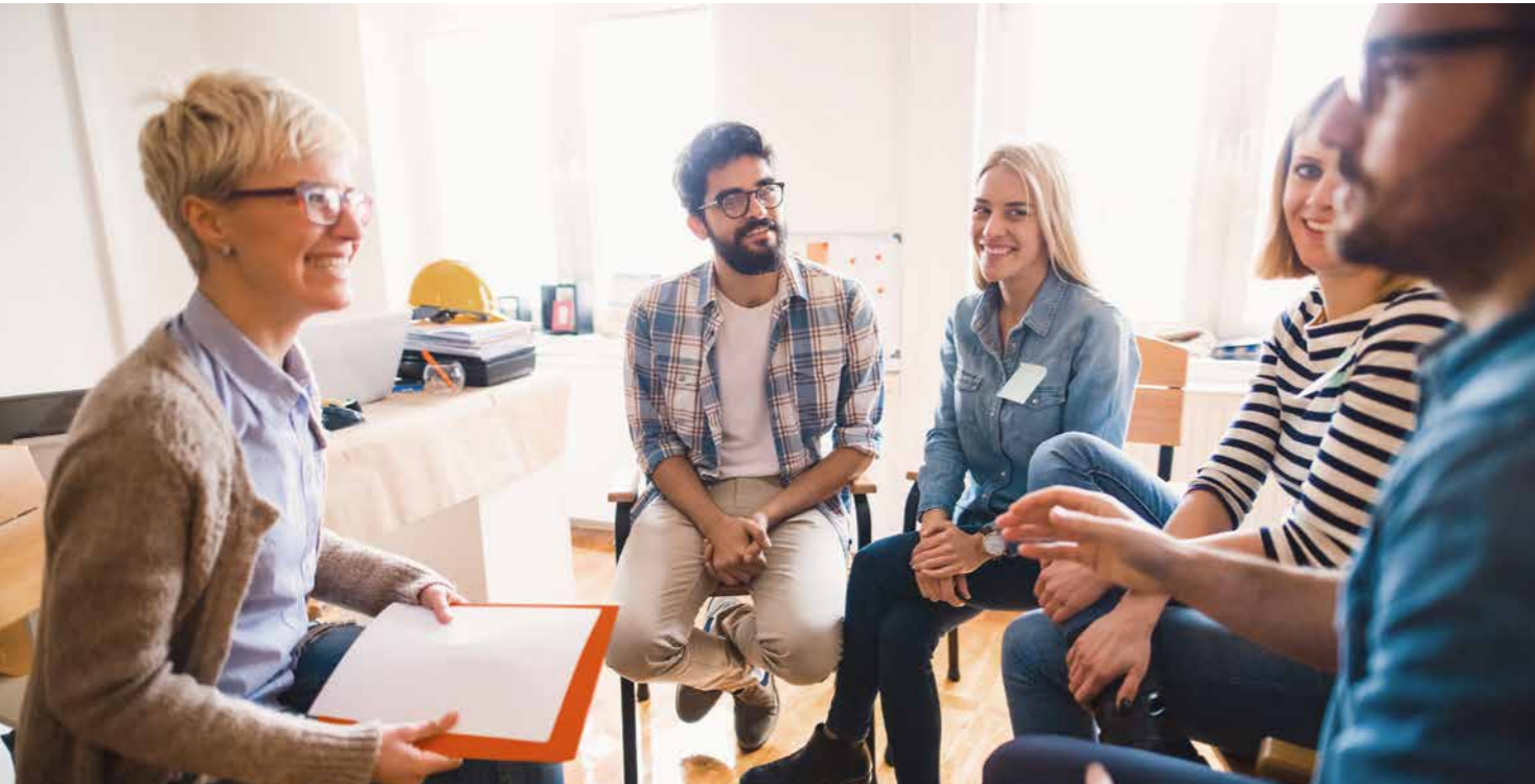
Unsere RehaStep-Coaches finden mit Ihnen heraus, welche Kompetenzen in Ihnen stecken.

In einem ausführlichen Erstgespräch informieren wir Sie über die einzelnen Schritte und klären, ob RehaStep der richtige Weg für Sie ist. Dazu besprechen wir, wo Ihre Interessen liegen und was gesundheitlich wichtig ist. Nach dem Gespräch entscheidet Ihr Leistungsträger mit Ihnen über eine Teilnahme.